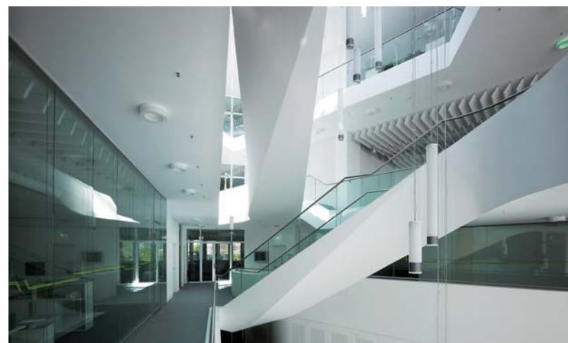
Jenseits der Konvention: Das ZVE ist viel mehr als ein weiteres Forschungsgebäude.

Ein Maximum an Raumfreiheit, ein Minimum an Hüllfläche und Baumaterial: Genauso formulierte der Bauherr die Bauvorgaben. Wie lässt sich das