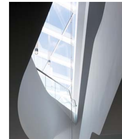
Glasdach des Atriums

Unsere Fachleute konnten an dem Bauvorhaben ihre Leistungsstärke aus-