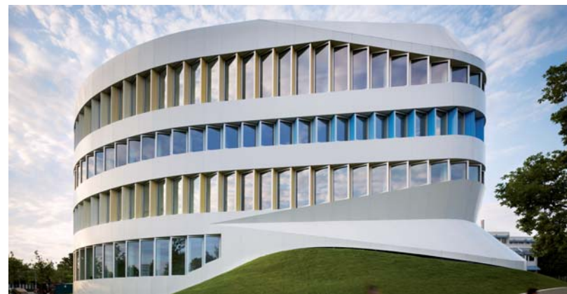
Revolutionäre Arbeitswelt: das Zentrum für Virtuelles Engineering in Stuttgart-Vaihingen.

Ein Bauherr, der ganz genau weiß, wie eine zukunftsweisende Arbeitswelt aussehen muss und seine Konzepte einbringen will? Für Architekten ist dies eine nicht ganz einfache Situation. Doch Ben van Berkel, Direktor von UNStudio, einem der derzeit meistbeachteten Architekturbüros der Welt, ist auf knifflige Anforderungen und progressive Architektur spezialisiert. Schon