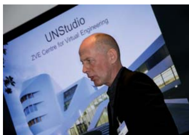
Architekt Ben van Berkel, UNStudio