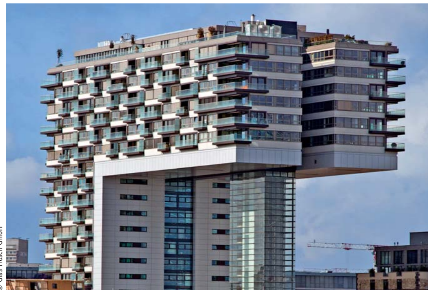
Beginnt erst jenseits des 9. Obergeschosses: Die 70 Meter lange Gebäudespanne.

Weitsicht, Erfahrung und Fingerspitzengefühl waren auch bei der Logistikplanung von uns gefragt: Die Platzverhältnisse auf der Baustelle waren sehr beengt, und die Transportmöglichkeiten innerhalb des Rohbaus waren nur eingeschränkt möglich. Wir entwickelten die Planung innerhalb kürzester Zeit, stimmten uns dabei kontinuierlich mit den beteiligten Fachingenieuren und der Bauleitung ab, so dass die Fertigung der Einzelkomponenten zeitnah erfolgen konnte.