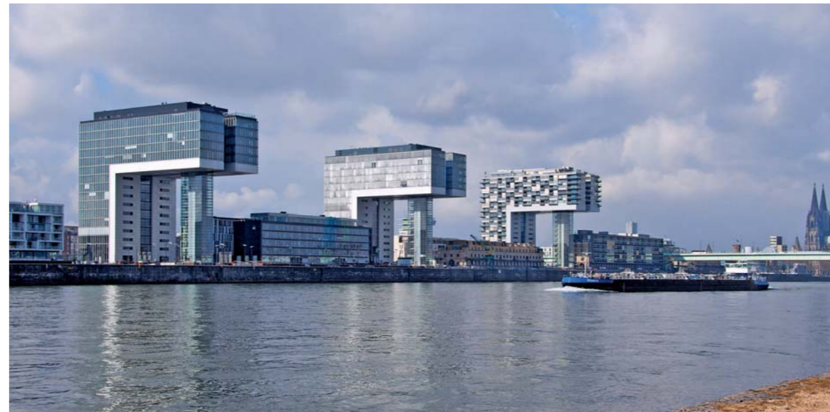
Tolles Trio: Die Gebäude erinnern an Kräne, die einst im Kölner Innenstadthafen die Flussschiffe beluden.

die Idee 1992 im Rahmen eines Wettbewerbs für den Rheinauhafen aufgriff. Es vergingen sieben weitere Jahre, in denen mehrere Arbeitsgruppen am Entwurf feilten, bis die endgültige Form der Kranhäuser gefunden wurde.