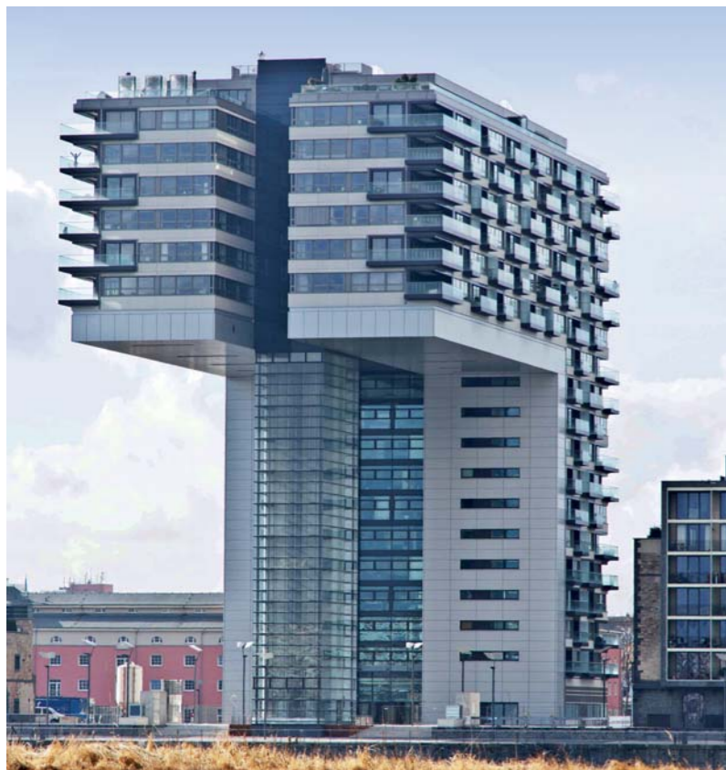
Futuristische Form: das „Pandion Vista“ gleicht einem auf den Kopf gestellten großen L.

„Ich kenne kein Wohnhaus mit ähnlicher Qualität“, so äußert sich Hadi Teherani meist in Interviews. Man kann diese Aussage auch tatsächlich nicht widerlegen. Die Lage des „Pandion Vista“? Ist exponiert und nicht duplizierbar. Die Gebäudeform? Wurde in dieser Art noch nicht realisiert. So ruht eine etwa 70 Meter lange horizontale Gebäudespanne stadtsseitig auf einem kubischen Turm – und ein schlanker Aufzugsturm trägt sie zur Flussseite hin. Auch das Wohnkonzept ist bis in den letzten Winkel ausgefeilt. Die Wohnungen im 11. bis 17. Stockwerk umschließen ein großzügiges, nach oben offenes Atrium; erreichbar sind sie nur über innen liegende, zum Atrium hin geöffnete Eingänge.