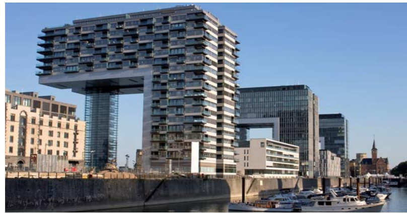
Ein Standort wie kein anderer: Das „Pandion Vista“ auf der Halbinsel des Rheinauhafens.